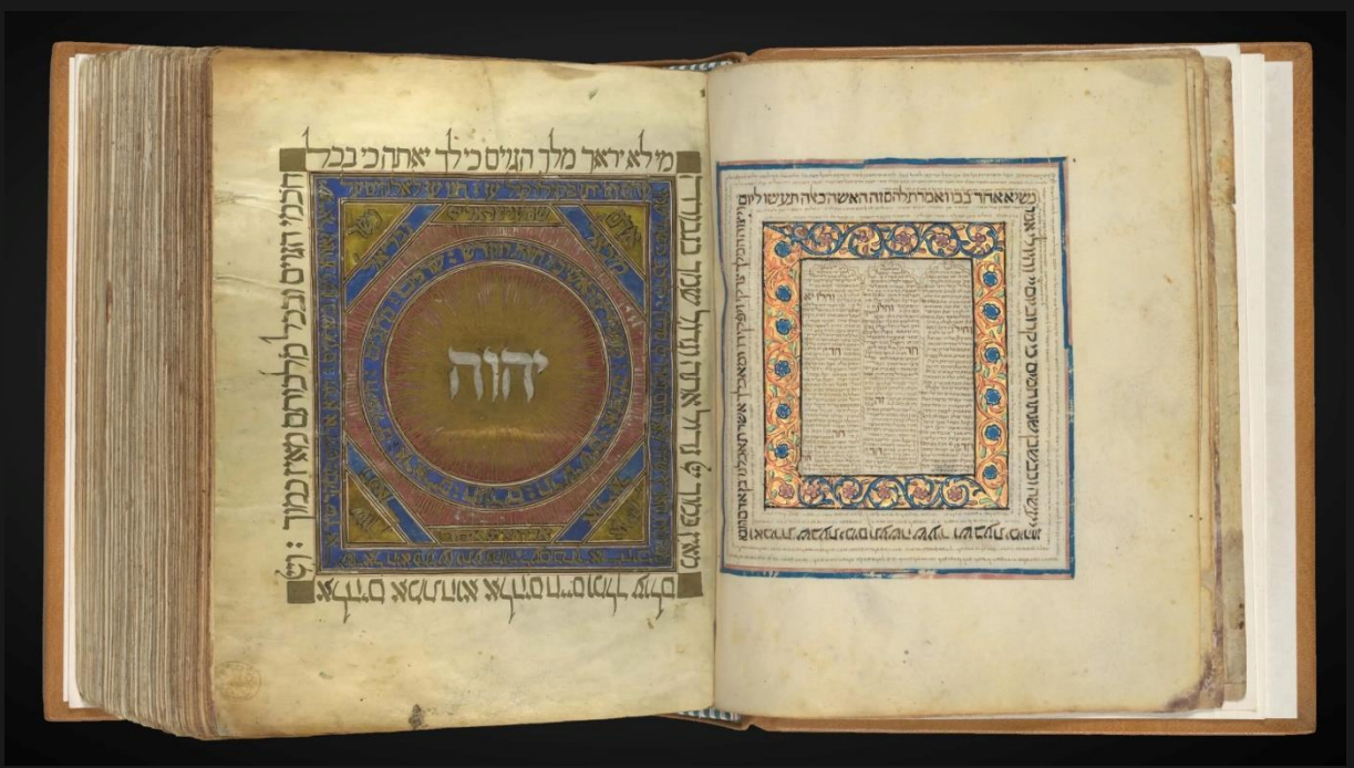
Sagradas Escrituras hebraicas, datada de 1384, contendo o Nome do Criador.

“O seu Nome permanecerá eternamente, o seu Nome se irá propagando de pais a filhos enquanto o sol durar e os homens serão abençoados Nele.” Salmos 72:17